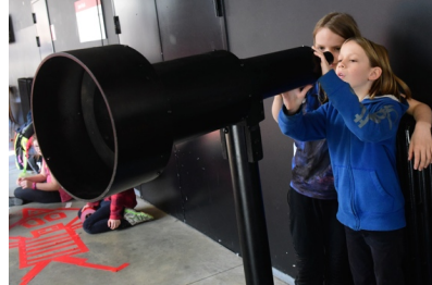
Het festival wist een brug te slaan tussen kunst en knutselen.